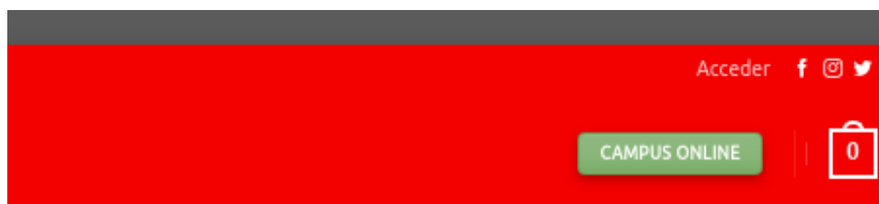
Link en el menú para acceder a la cuenta de usuario

Para logearse y entrar a la cuenta de usuario se debe hacer clic sobre el link acceder , que se encuentra en la parte de arriba a la derecha de la página web.