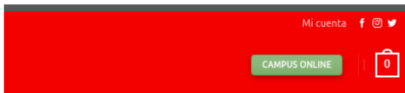
Acceso a la cuenta de usuario

Una vez logeado, en la parte superior derecha aparece el link mi cuenta . Pasando el ratón por encima, se despliegan las diferentes opciones disponibles.