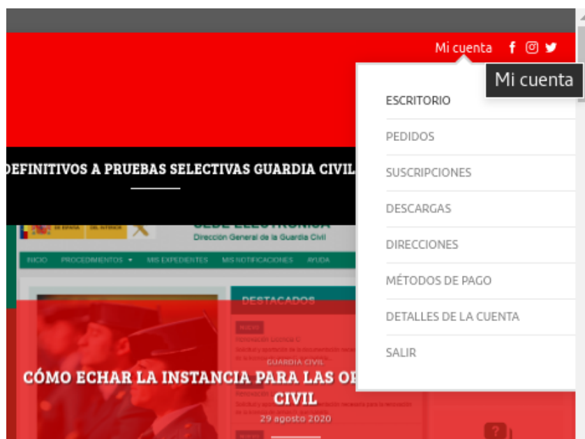
Menú de la cuenta de usuario