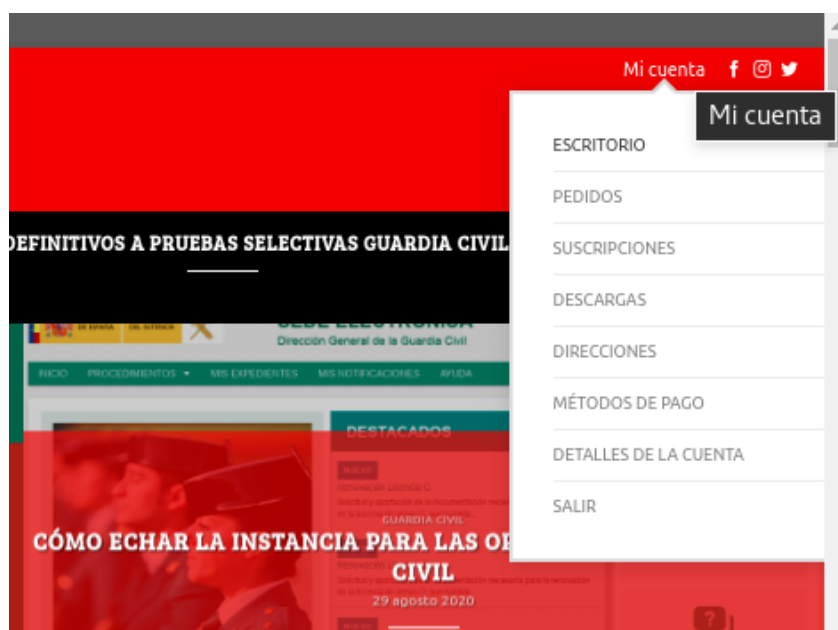
Menú de la cuenta de usuario